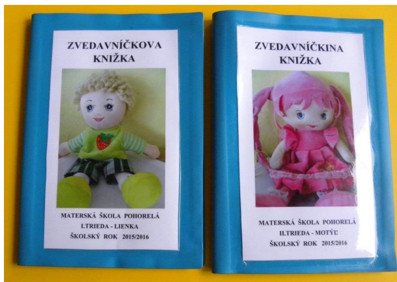
Obr. 1 Zvedavníčkova a Zvedavníčkina knížka