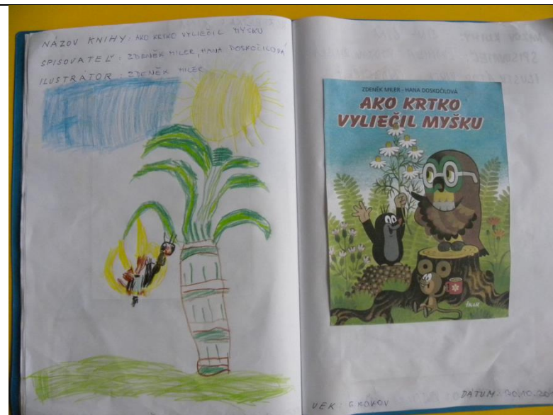
Obr. 3 Zvedavníčkina knižka – Obrázky k rozprávke II.