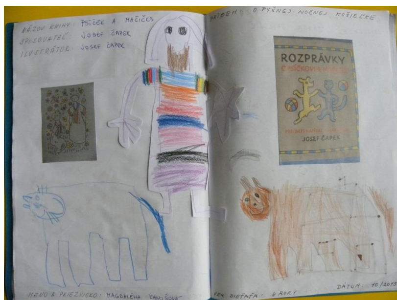
Obr. 2 Zvedavníčkina knížka – Obrázky k rozprávke I.